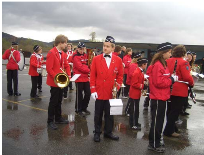
Oppstilling på skoleplassen 17Mai 2007. Surt og kaldt!

Etter "Ungdom på Scenen" lokket 17'de Mai i det fjerne og før vi visste ordet av det var vi ute og marsjerte i gatene igjen. I år spilte vi ikke i byparken, men bestemte oss for å vekke folk i Kulstadlia med spilling i gatene. Det var regn og litt surt, men det ble enda verre, ja faktisk en skikkelig hustrig affære å marsjere i barnetoget! Alle var søkkblaute til skinnen etterpå. Men under borgertoget kom det plutselig frem noen solgløtt og så var vi såre fornøyde igjen. Det skal ikke så mye til.