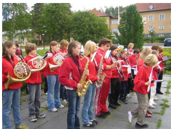
Spilling i parken i Storuman Sept.2006

Fjorårssesongen startet med en korpstur til Storuman. Vi flyttet turen ifra juni til september fordi vi syns det ble for travelt i tida rett etter skolestart. Deretter var høstsesongen i gang og var som vanlig rimelig travel.