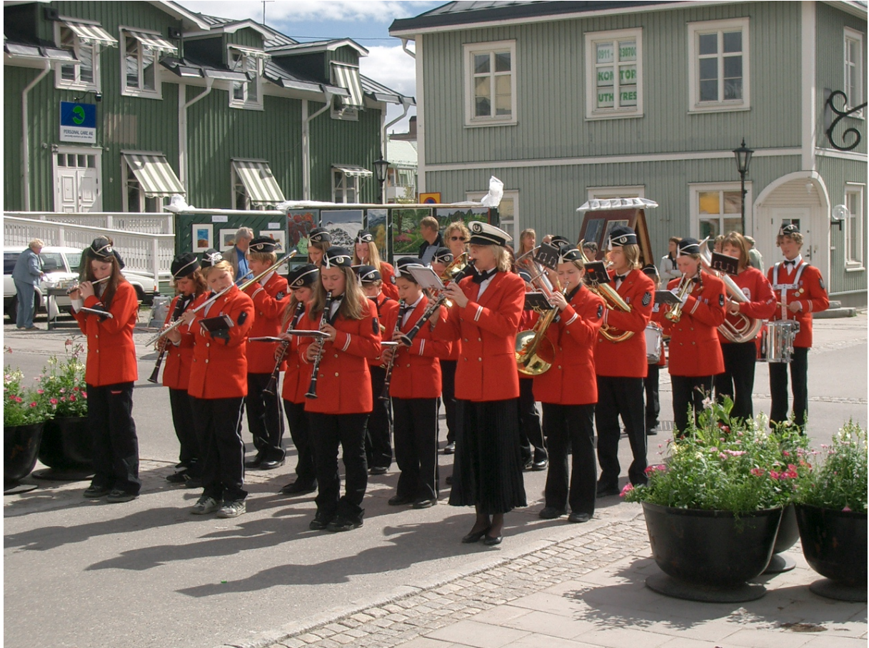
Spilling på Rådhusplassen – Piteå